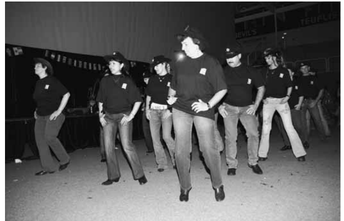
und in Aktion.