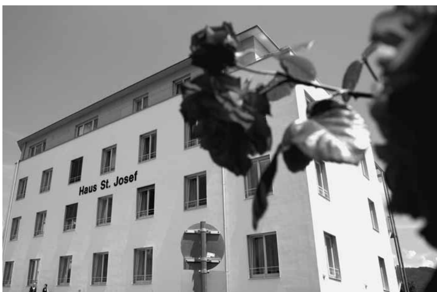
Das neu erstellte Alten- und Pflegeheim St. Josef mit 94 Plätzen in sechs Hausgemeinschaften und acht heimgebundenen Wohnungen.