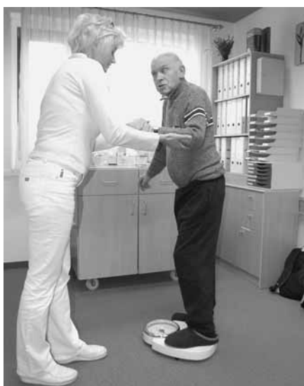
Die Senioren sollten weder zu viel ab- noch zu viel zunehmen. Deshalb ist regelmäßiges Wiegen wichtig.

Es gibt vier Hauptrisiken für die Bewohner aufgrund ihres Alters, ihrer Multimorbidität und ihrer Pflegebedürftigkeit. Das sind die Kachexie (Untergewicht), die Dehydratation (Austrocknung), die Sturzgefahr und der Dekubitus. Für jedes Risiko gibt es in den Deutschen Expertenstandards eine eigene Handlungsleitlinie. Sie definiert das Problem, gibt Ziele vor und ist ein