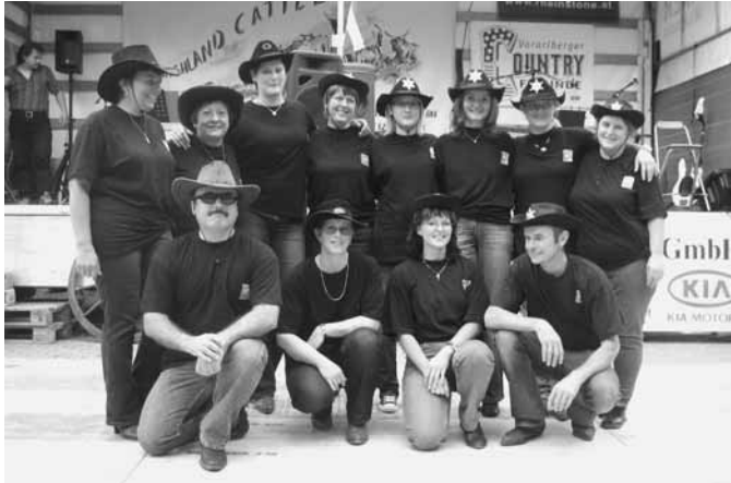
„Tscherms Linedancer“ in Ruheposition