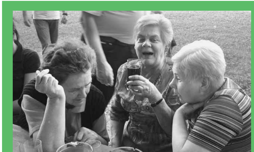
Gute Stimmung beim Dämmerstopp in der Wohnanlage.

ter 17 Jahren, ebenso viele sind 80 Jahre und älter.