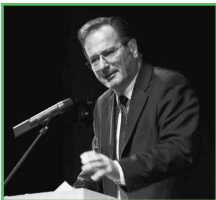
Wie ein gesellschaftlicher Werteverlust zu verhindern ist, erläuterte Dr. Klaus Kinkel.