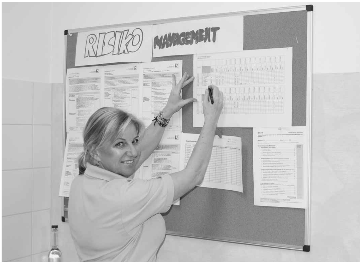
Die Befindlichkeiten jedes Bewohners in einem Wohnbereich werden neben der üblichen individuellen Dokumentation auch in einer gemeinsamen Tabelle erfasst. So haben die Pflegekräfte einen besseren Überblick.

NÜZIDERS – Die Mitarbeiter des Sozialzentrums St. Vinerius haben sich im Jahr 2007 intensiv mit dem Thema Risikomanagement beschäftigt. Dabei haben sie sich vor allem an den Deutschen Expertenstandards mit ihren Handlungsleitlinien orientiert. Es ist ihnen gelungen, ein System zu schaffen, mit dem das Pflegepersonal ohne großen Aufwand die wichtigsten Risiken jedes einzelnen Bewohners erfassen und im Auge behalten kann.